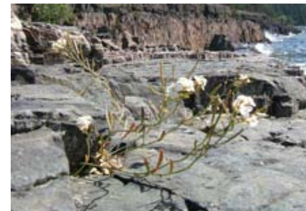
Strandtrav ( Cardaminopsis petraea )

Länsstyrelsen Västernorrland © Bakgrundskartor Lantmäteriet, dnr 106-004/188-Y