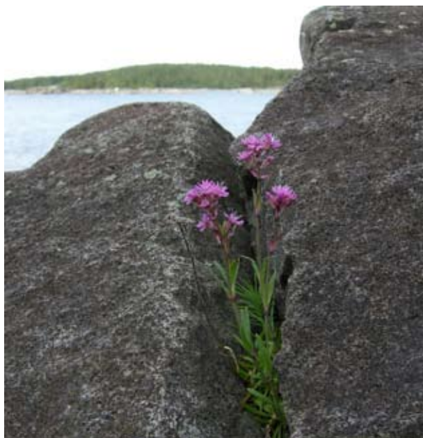
Fjällnejlika ( Lychnis alpina )

De inbjudande solklipporna når du via de stigar som löper genom reservatet. Tänk på att vara försiktig vid bad. Hällarna kan vara mycket hala!